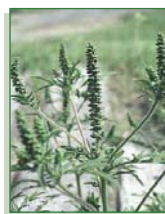
HERBE À POUX