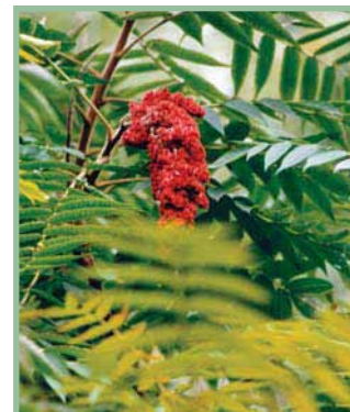
Sumac vinaigrier

L'inflammation de la peau est le résultat de la réponse immunitaire du corps humain aux cellules contaminées. La dermatite n'est donc pas transmise à un autre individu par le contact des plaies, sauf si l'urushiol est encore présent sur la surface de la peau. Un grand nombre d'animaux et d'oiseaux sont complètement insensibles, parce que leur système immunitaire est différent de celui des humains.